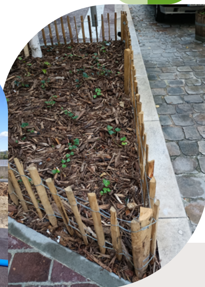
Photo : Piquets ronds