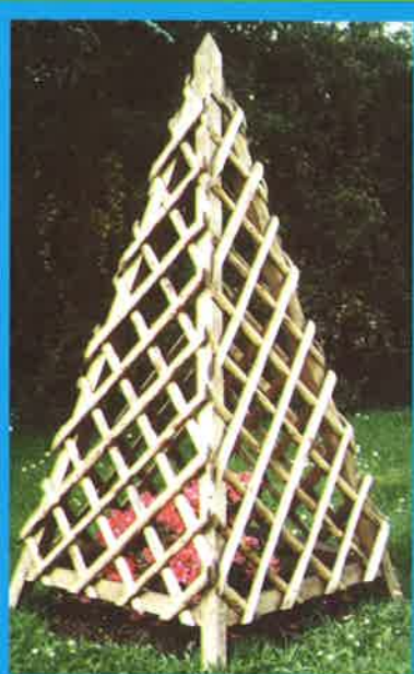
Réf. 1-2-3 : Pyramides en lisses dressées