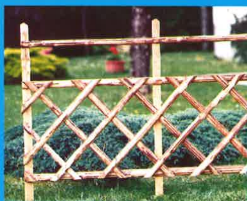
Réf. 5 : Barrière croisée