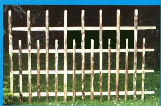
Réf. 8 : Barrière claire-voie 8 cm