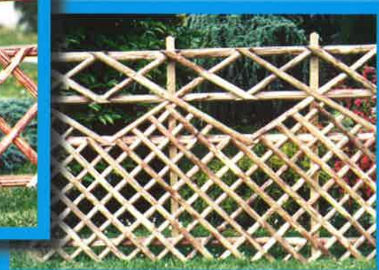
Réf. 6 : Barrière croisée alternée